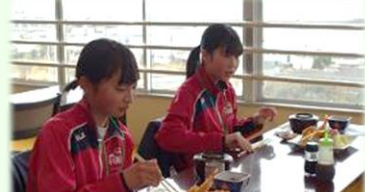
伊良湖のお店で温かい昼食