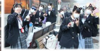
2日目 富士急ハイランドにて