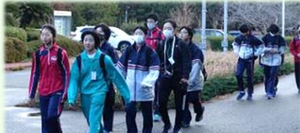
風の強い日でしたが、渥美の自然を感じながら、頑張って歩きました

12月17日、2年生が立志歩行を行いました。学校を出発して、校区内に設定した約27kmのコースを歩き、学校にゴールしました。PTA・地域の方のご支援があって行事が実現できました。歩く途中では、多くの地域の方からの声援があり、温かい心と歩くパワーをいただきました。ありがとうございました。