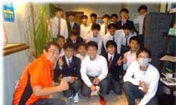
1日目 伊豆のペンションで宿泊

10月12日から3日間、3年生が修学旅行に行ってきました。旅行先は富士山周辺の山梨、静岡方面でした。楽しい思い出がたくさんできました。