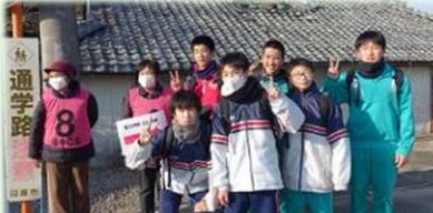
地域の方が支援してくださりました