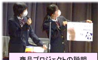
商品プロジェクトの説明

1学期から、お土産の試作をしたり、工夫をしたりしてきました。11月17日、地域の方6名を講師として招いて発表会を行い、商品プロジェクトの評価をしていただきました。