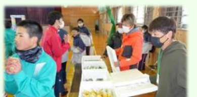
PTAの方から温かい飲み物