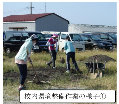
校内環境整備作業の様子①

PTAの皆様や先生方のご助力により、一年間無事に過ごせることができました。大変感謝しております。ありがとうございました。