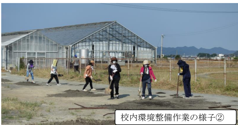
校内環境整備作業の様子②