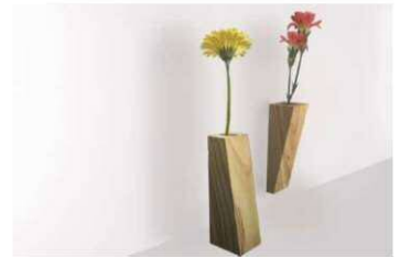
松野由夏 「フラワーベース作り」 2/1 (土) 13:30 ~ 2/2 (日) 10:00 ~ 各回 10名 無料

カラーリングマムを染めて、田原市のお花をたっぷり使ったアレンジメントをお作りいただく体験教室です。オンラインワンのカラーリングマムを染めるところから体験いただけます。ゲッコウフラワーアトリエ代表の森田久美江と、輪菊農家・染め師の林さとみか講師を務めます。低学年未満のお子様は保護者同伴にてお願い致します。