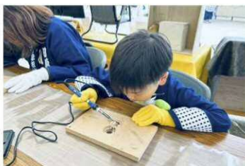
レオジブラン和菓 「ウッドバーニング体験&手作り木製品販売」 2/2 (日) 10:00/10:45/11:30 ~ 13:30/14:15/15:00 ~ 各回 12名 700円

ワークショップの設営に利用したテーブルの端材(ヒノキ)を使ってフラワーベースを作ります。田原市のお花で作った染料を使って色をつけたり自由な形に仕上げてください。小学生以下のお子様は保護者同伴でお願いいたします。