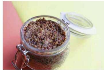
中山晴奈 「渥美半島マスタード作り」 2/1 (土) 10:00 ~ 2/2 (日) 10:00 ~ 各回 10名 1,000円