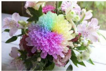
ゲッコウフラワーアトリエ 「染め菊&アレンジメント体験教室」 2/1 (土) 10:00 ~ / 13:30 ~ 各回 15名 1,000円

13:30 / 14:30 ~ 各回 30分 〔有〕鈴木養蜂園 「菜の花はちみつを使って ナッツのはちみつ漬けを 作ろう」