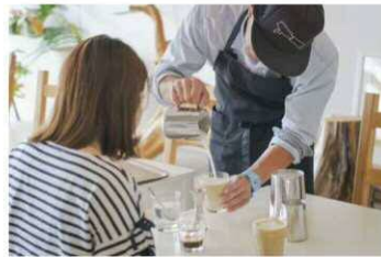
DIEZ café/ farm 「エスプレッソコーヒーの秘密」 2/1 (土) 10:00 ~ / 13:30 ~ 各回 5名 500円