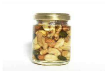
〔有〕鈴木養蜂園 「菜の花はちみつを使ってナッツのはちみつ漬けを作ろう」 2/2 (日) 13:30 ~ / 14:30 ~ 各回 8名 1,000円

木材を使用したウッドバーニング(焦がし絵)のワークショップです。キーホルダーなどの木材に、自分でデザインしたイラストをハンダゴテや電熱ペンを使って焼き付けてもらいます。自分で焼き付けたキーホルダーなどをお持ち帰りいただけます。