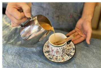
こも田のカレーパン 「マサラチャイのつくり方 ~ インドの暮らしとチャイのある風景 ~」 2/2 (日) 13:30 ~ / 14:30 ~ 各回 12名 無料